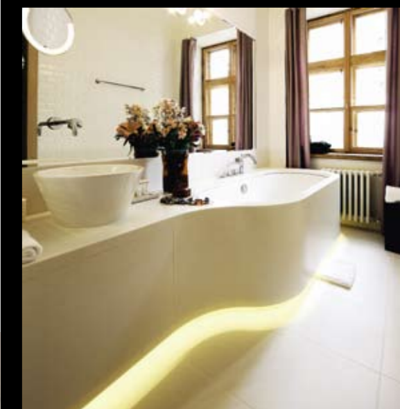
Izteikti mūsdienīga dizaina vannas istabas.