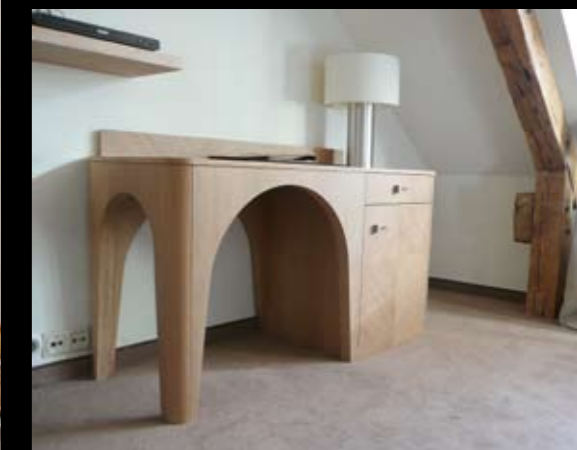
Īpaši katra viesničas numura konfigurācijai dizainētās mēbeles (autors Reinis Liepiņš) tikko manāmas atsaucis uz pagātni.