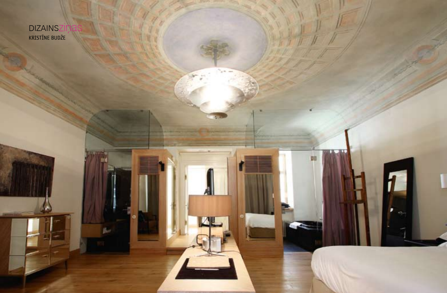
Otrā stāva numurus ar vēsturiskajiem griestu gleznojumiem var savienot vienā karaliskā apartamentā.