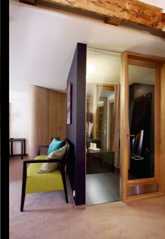
Lielākā daļa vannas istabu no pārējās numuru telpas atdalītas vien ar stikla starpsienu.