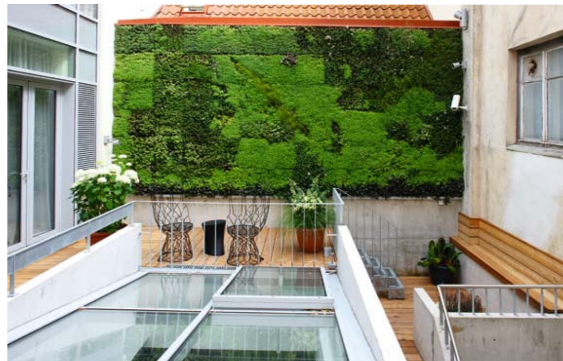
Otrā stāva līmenī esošā zaļā siena ir galvenais iekšpagalma vizuālais akcents.

IEKŠPAGALMS AR ZAĻO SIENU Viesničā atrodas restorāns ar atsevišķu ieeju no Miesnieku ielas un pagalmā izvietots neliels SPA. Iekšpagalma jaunā izbūve ir vēl viens vēsturiskā nama arhitektoniskā tēla ieguvums. Ēka nav tikai mehāniski palielināta uz šīs brīvās platības rēķina. Pagalmu veiksmīgi pārveidojot par daudzpakāpju terašu sistēmu, ir iegūta arī estētiska ainava, kas paveras no tiem viesničas numuriem, kuriem logi izvietoti uz iekšpagalma pusi. Pirmā stāva līmenī gandrīz visu pagalma platību aizņem SPA apjoms, otrajā stāvā izvietota atšķirīgu līmeņu terase un redzams namam pieguļošo SPA telpu stiklotais jumts. Te atrodas arī iekšpagalma galvenais vizuālais akcents – siena ar vertikālo augu stādījumu. Savukārt nama pēdējā stāva līmenī uz viesničas jaunā, mūsdienās celtā apjoma jumta izvietota vēl viena terase, no kuras Doma baznīcas tornis šķiet teju ar roku aizsniedzams.