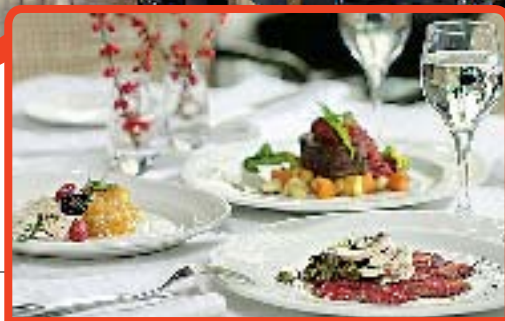
• Ресторан при гостинице Neiburgs — это история про неожиданные кулинарные потрясения.